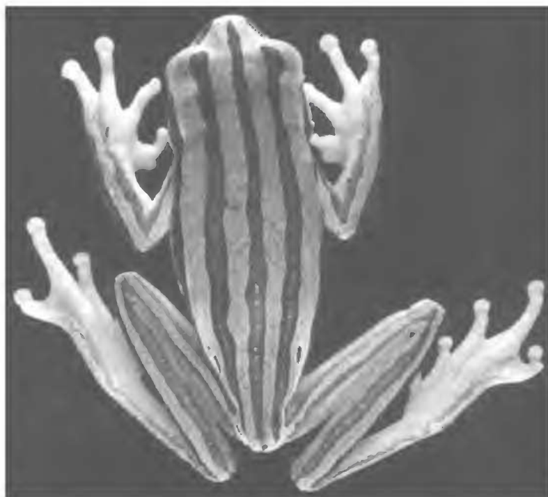
Fig.1- Hyla latistriata sp.nov., holótipo (MNRJ 18753; CRC 35,3mm), vista dorsal.

Descrição – Aspecto robusto (Fig.1); comprimento